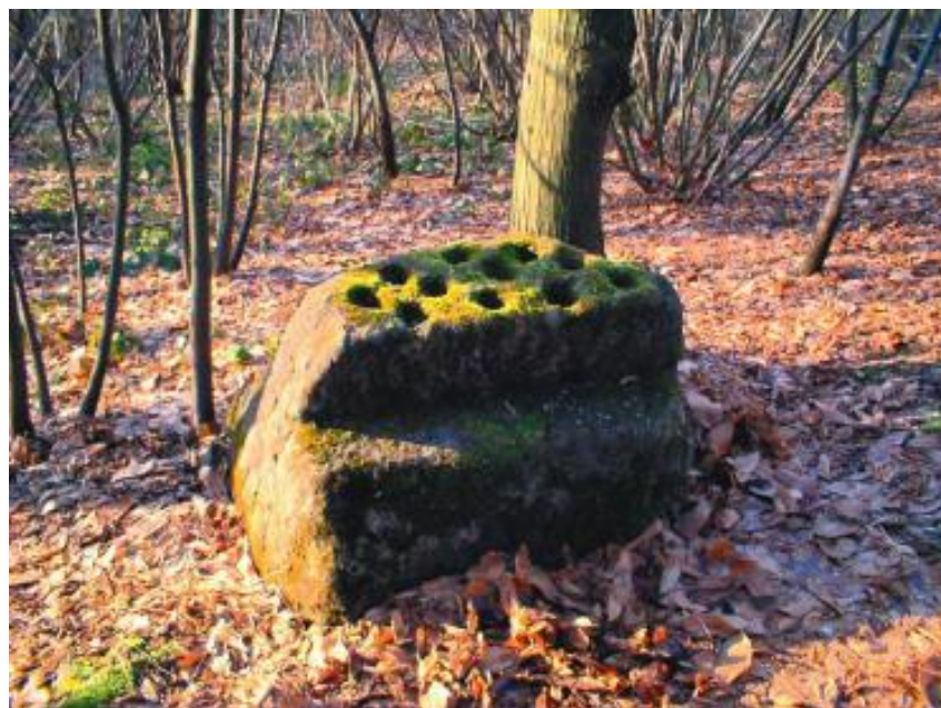
Incisioni in Val Bormida: il masso della Colla di Millesimo

Da Genova o Ventimiglia: autostrada A12 Genova-Ventimiglia, poi A6 Savona-Torino, uscita Millesimo. Da Torino autostrada A6 Savona-Torino uscita Millesimo. Dal casello proseguire seguendo le indicazioni per Cosseria